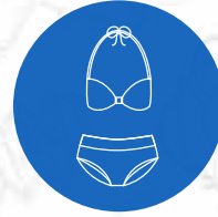
Ropa de baño