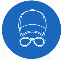
Gorro y lente de sol