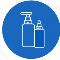
Bloqueador y repelente