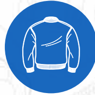
Abrigo ligero por el embarque